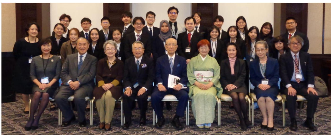
2023年3月第1期生奨学生期間終了式にて